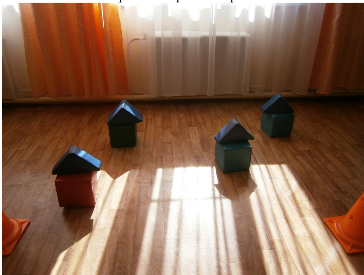
Эстафета «Построим скворечники»