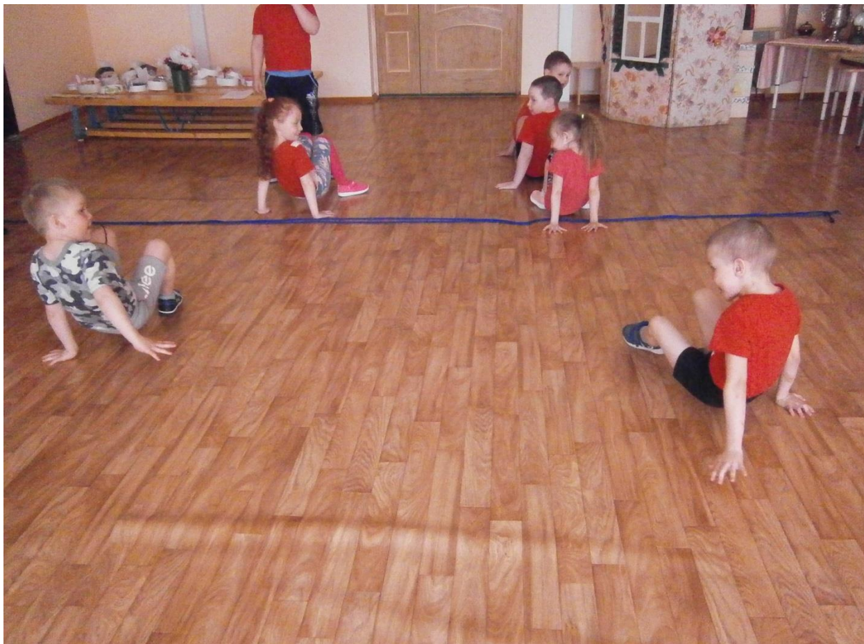
Эстафета «Весенние раки – раки забияки»