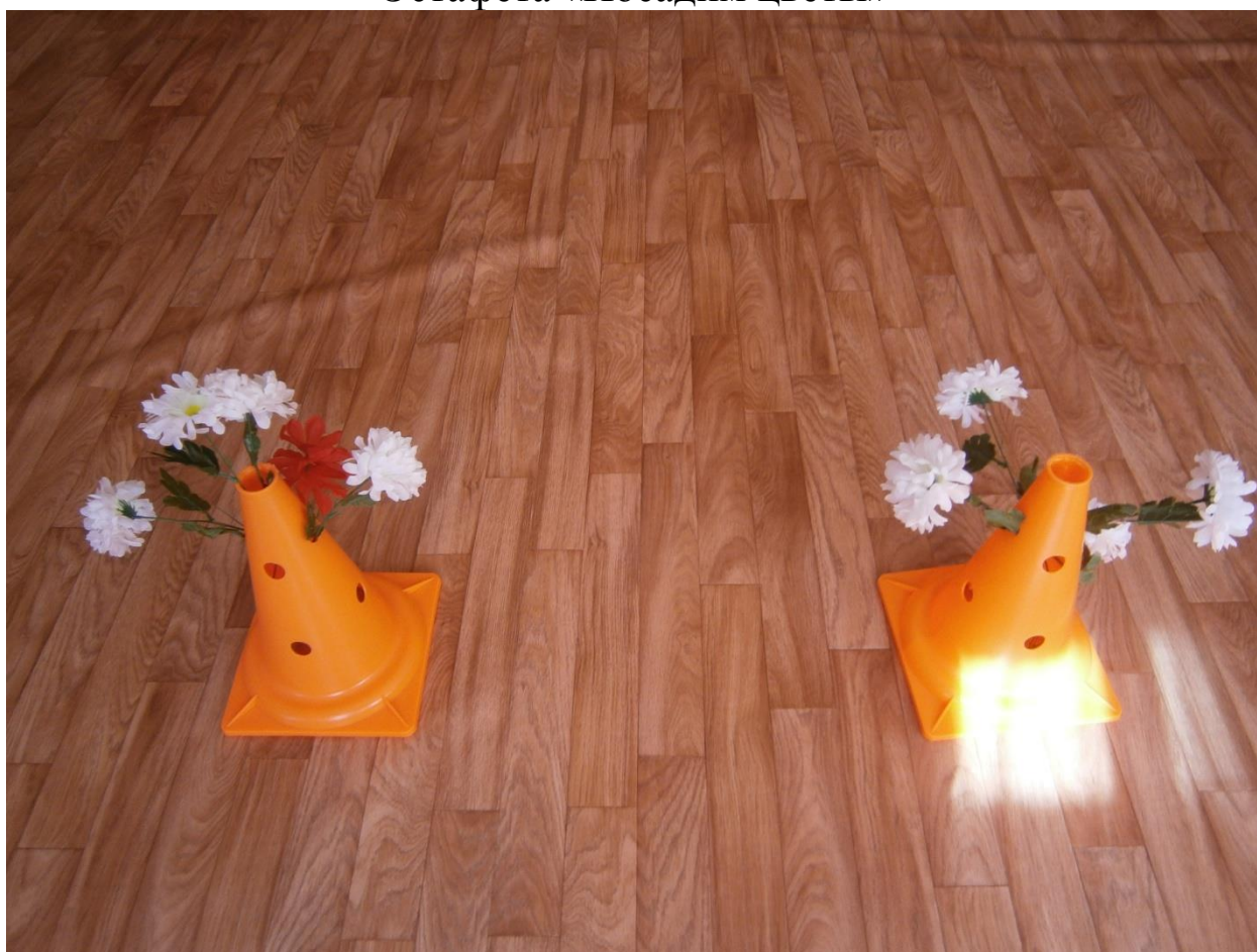
Эстафета «Посадим цветы»