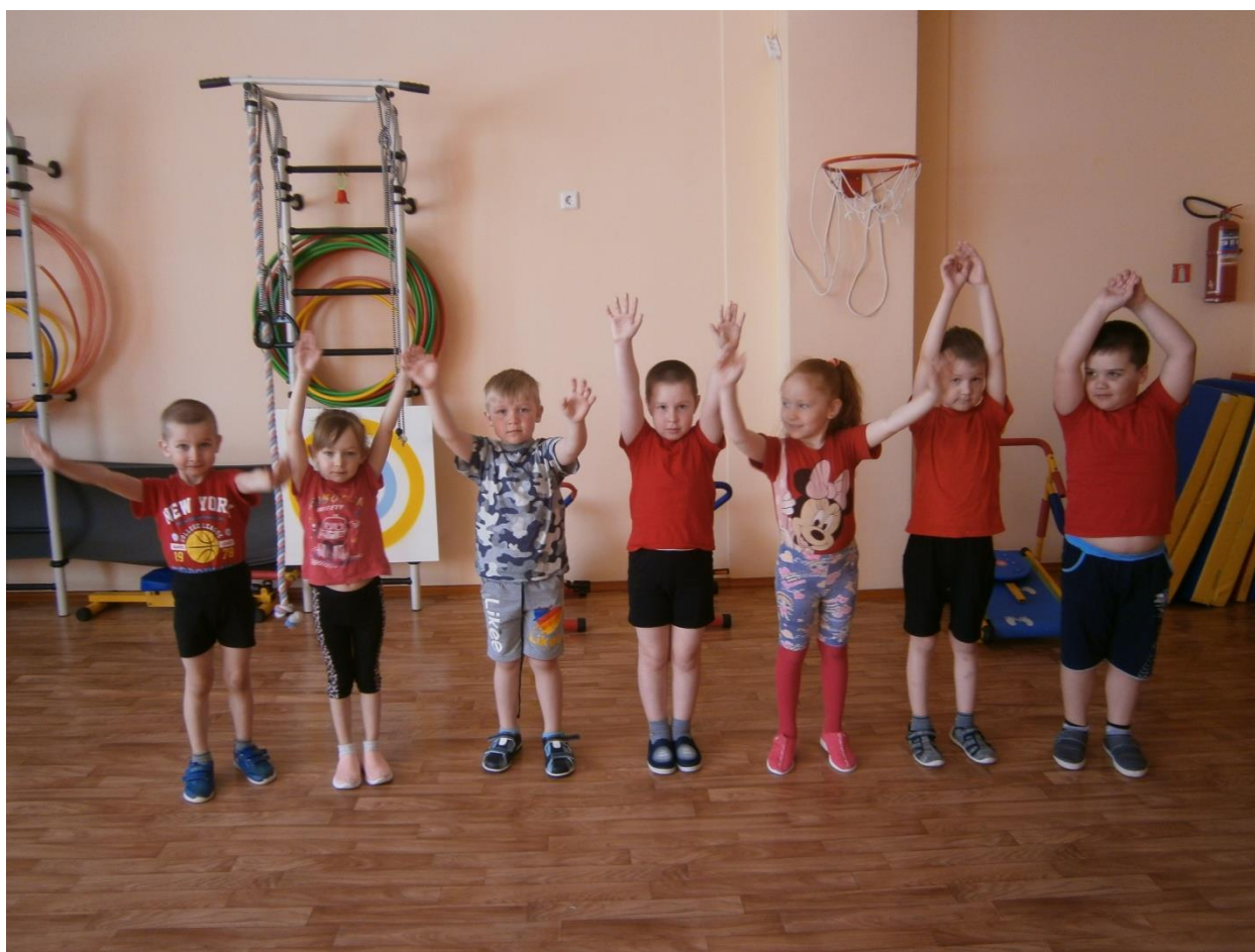
Малоподвижная игра «Солнышко, дождик, ветер»

Методы и приемы: наглядный, словесный, практический.