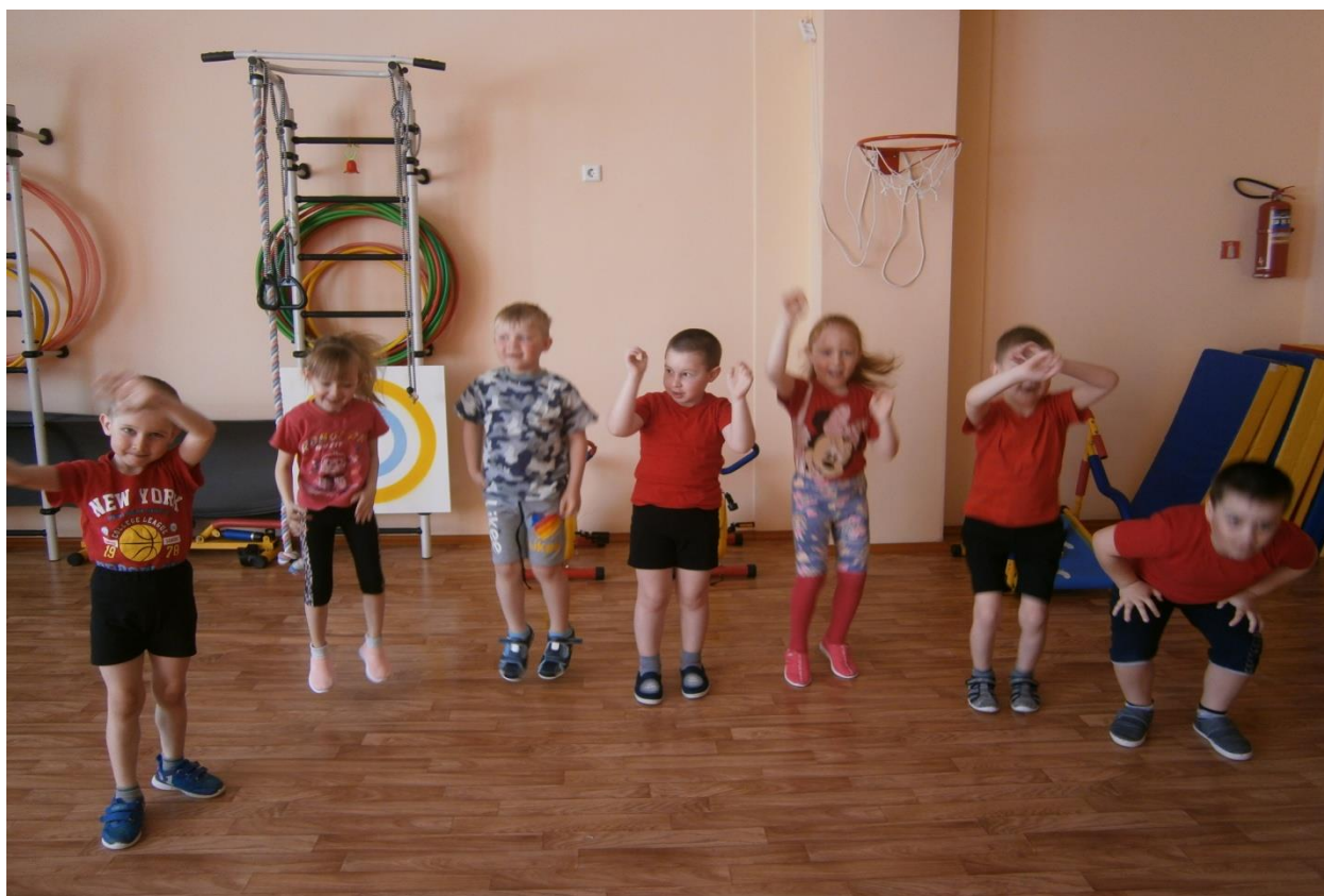
Малоподвижная игра «Солнышко, дождик, ветер»