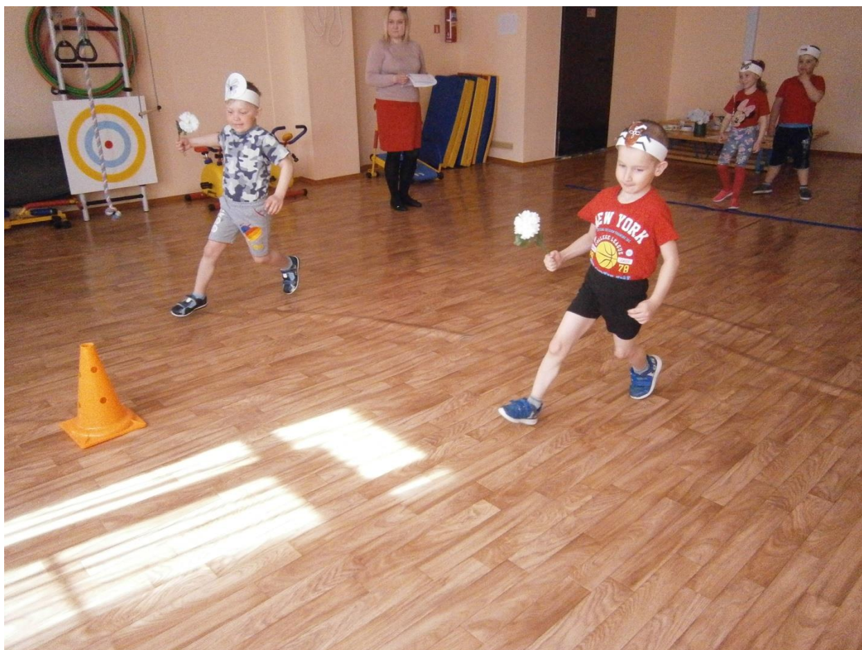
Эстафета «Посадим цветы»