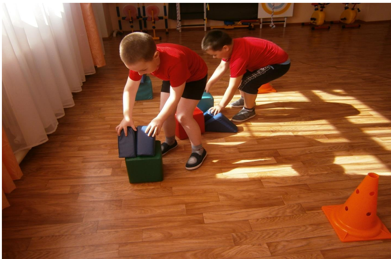
Эстафета «Построим скворечники»