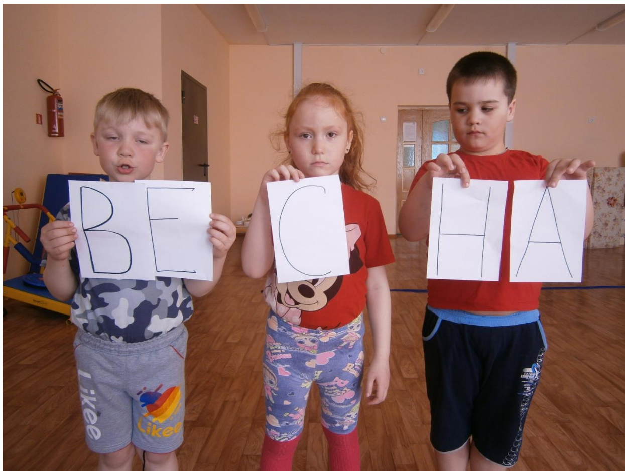
Эстафета « Соберем слово весна»