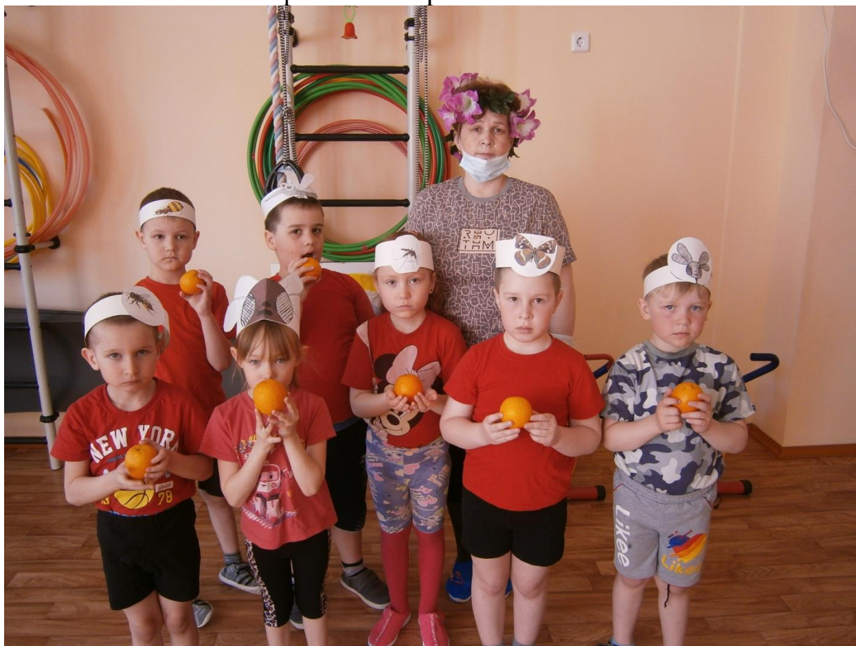
Фото с угощением