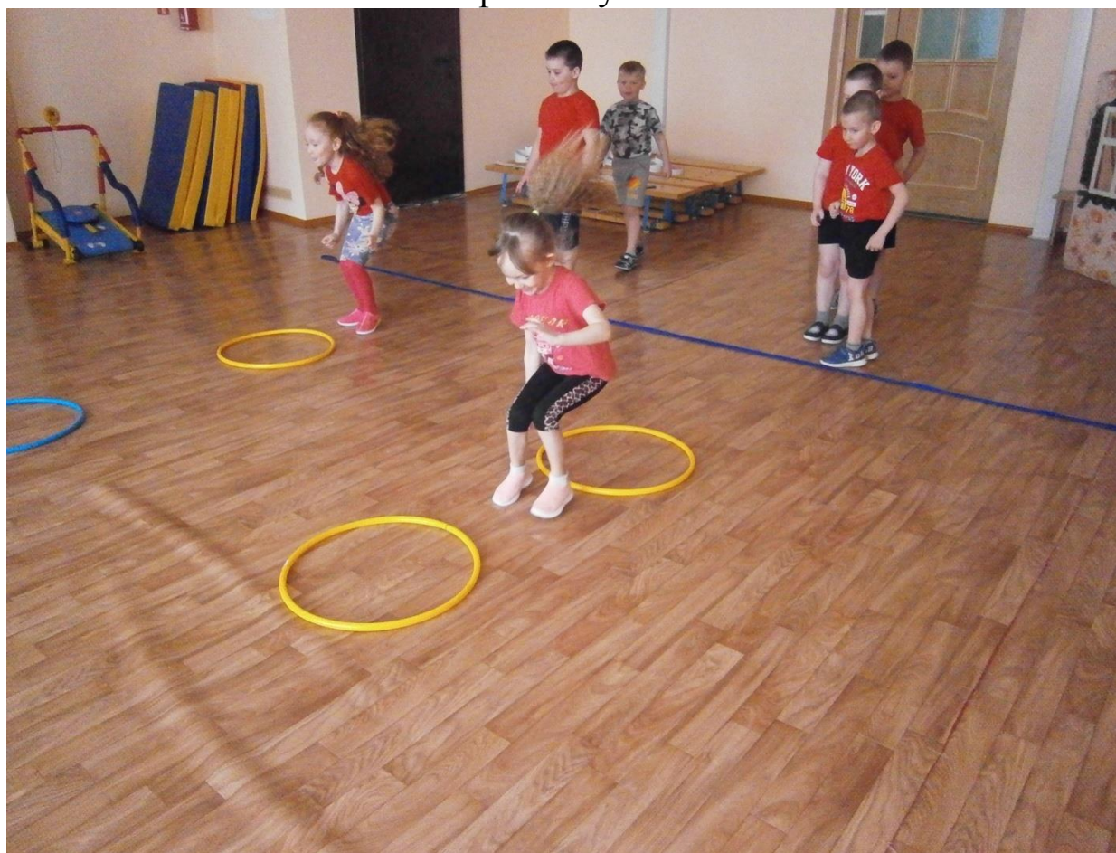
Эстафета «Перепрыгни через лужи»